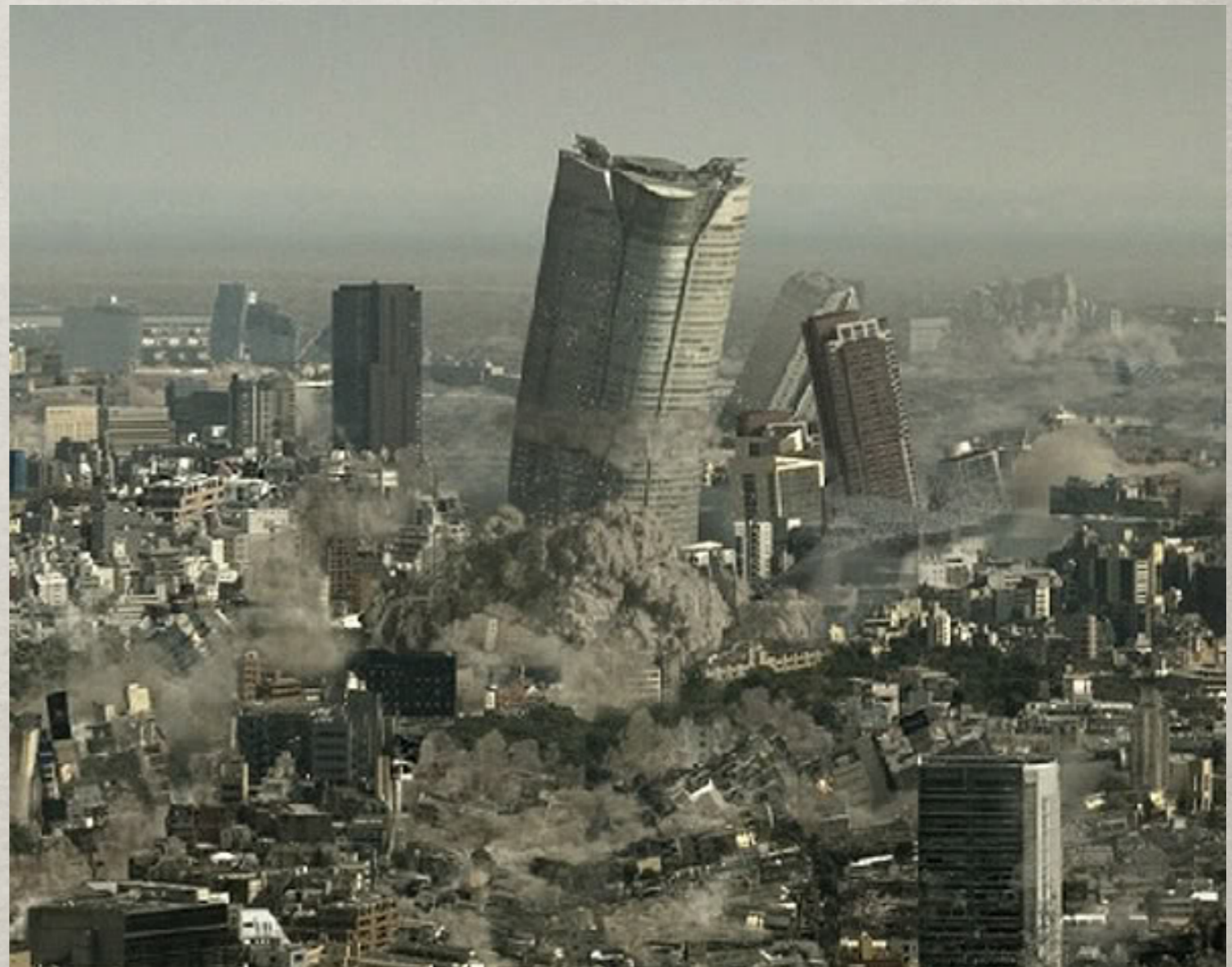
Nihon Chinbotsu, 2006.