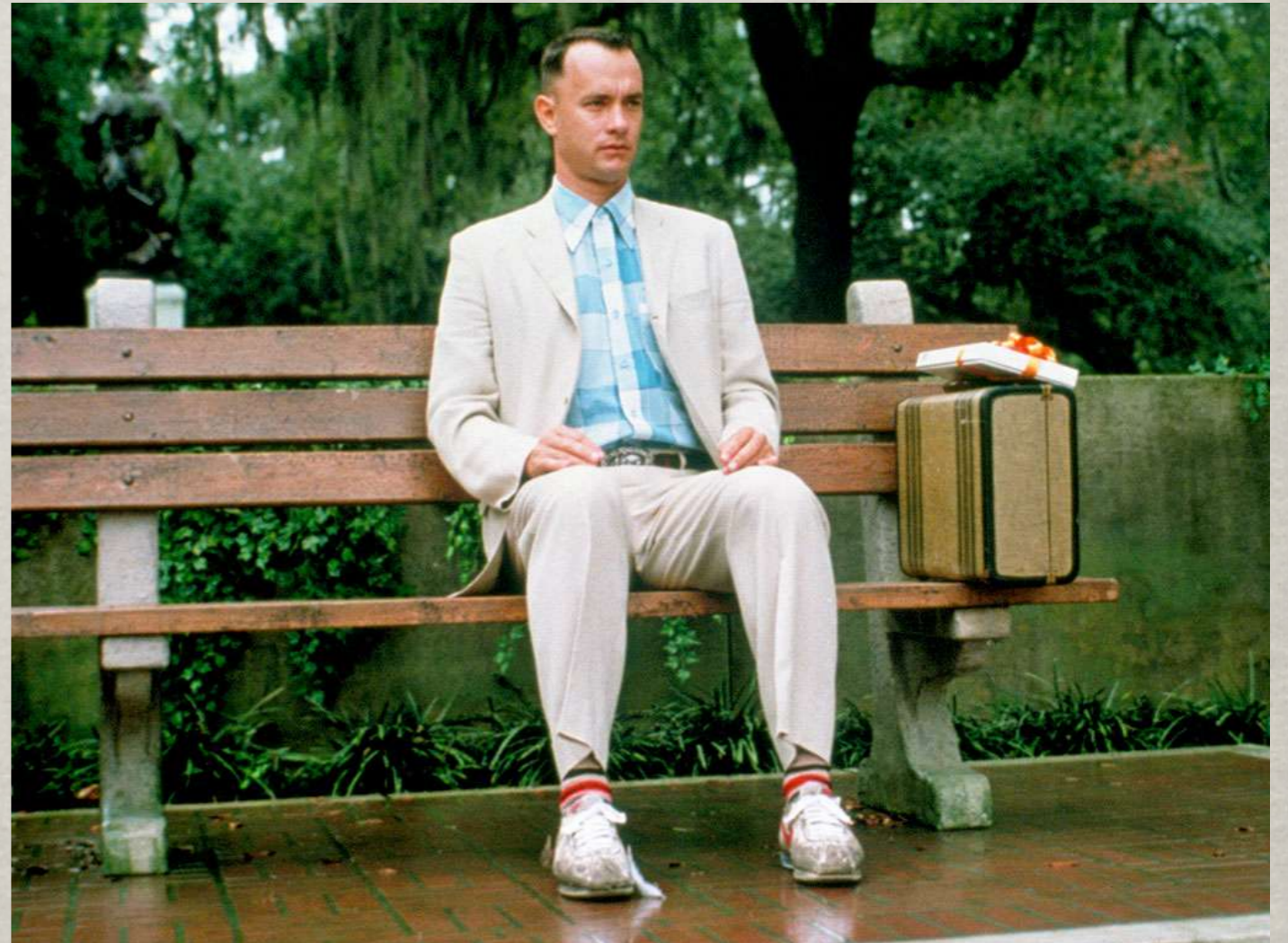
Forrest Gump, 1994.