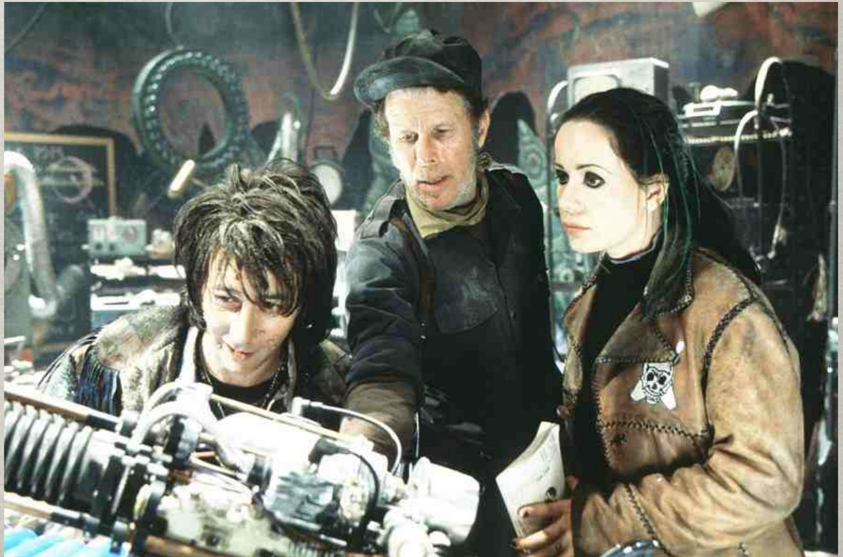
Mystery men, 1999.