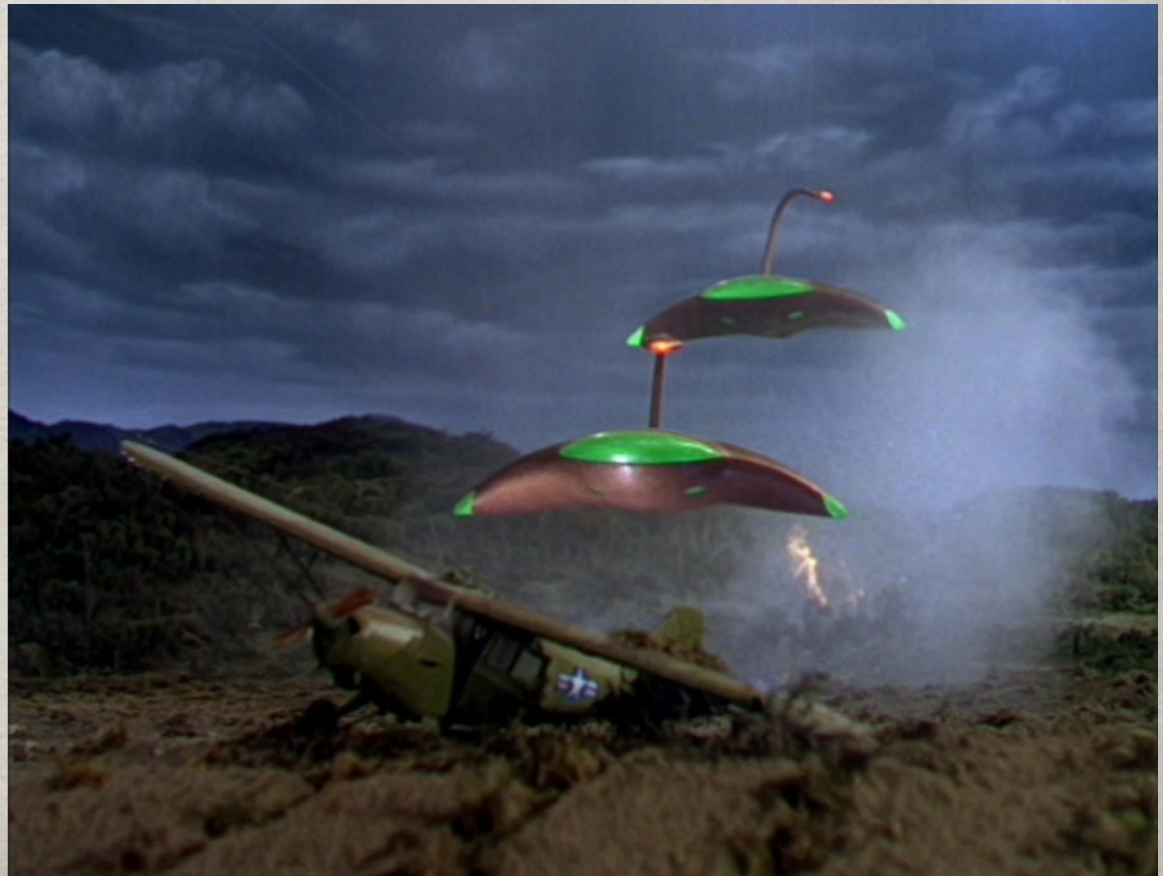
War of the worlds, 1953.