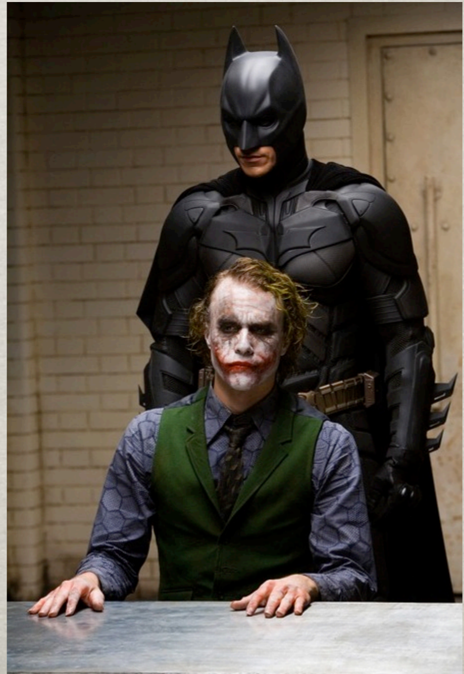
The Dark Knight, 2008.