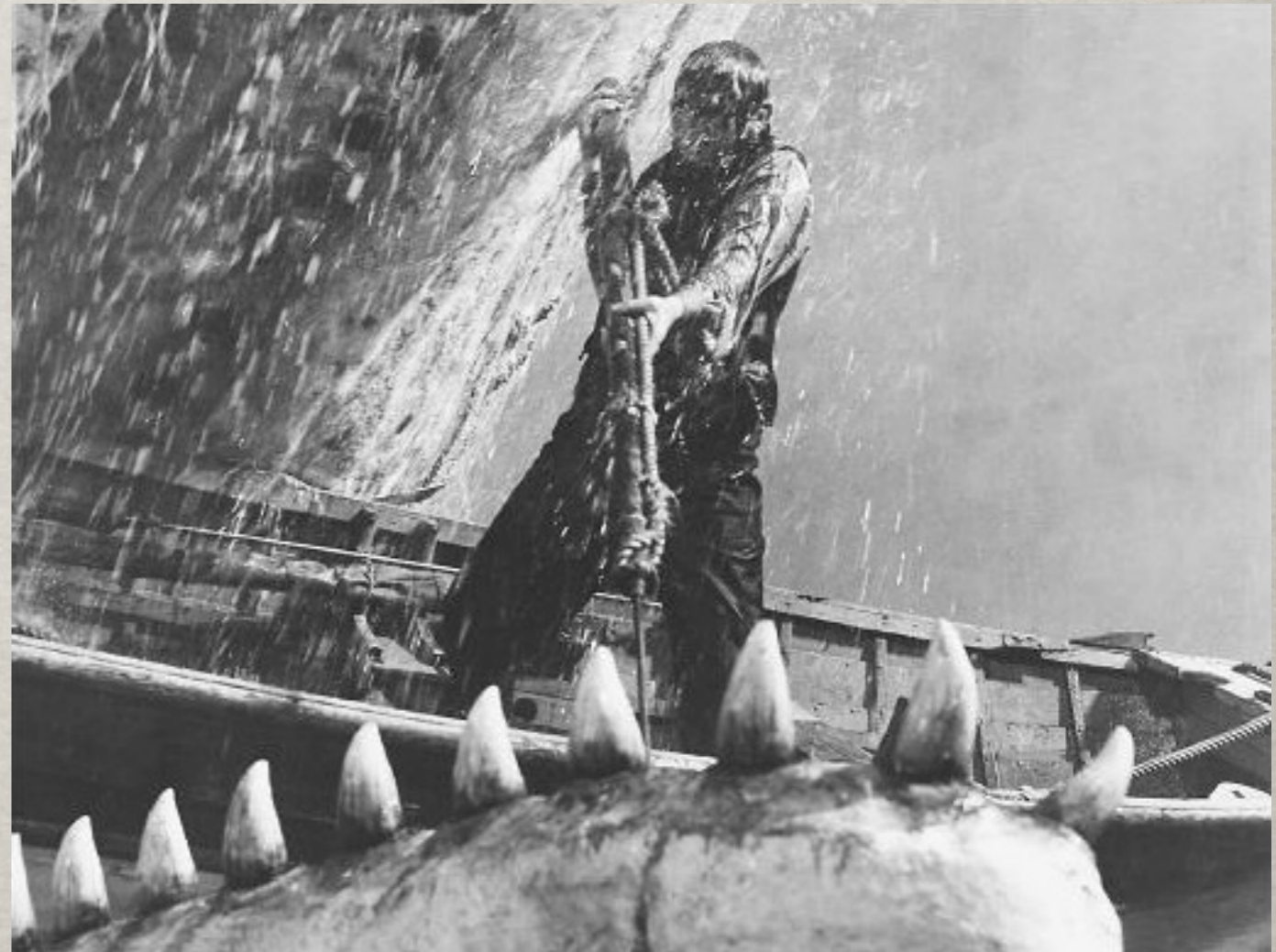
Moby Dick, 1956.