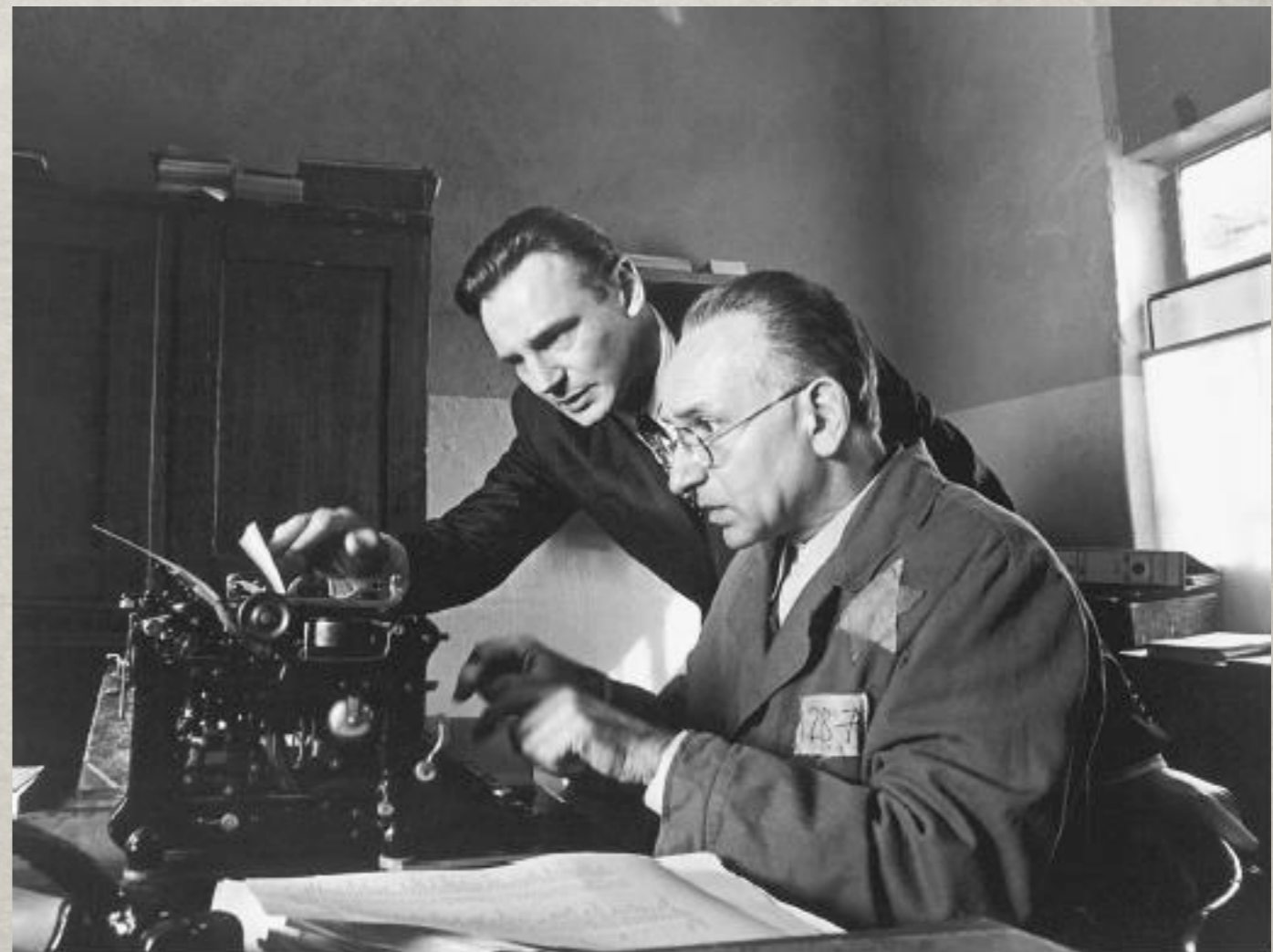
Schindler's list, 1993.