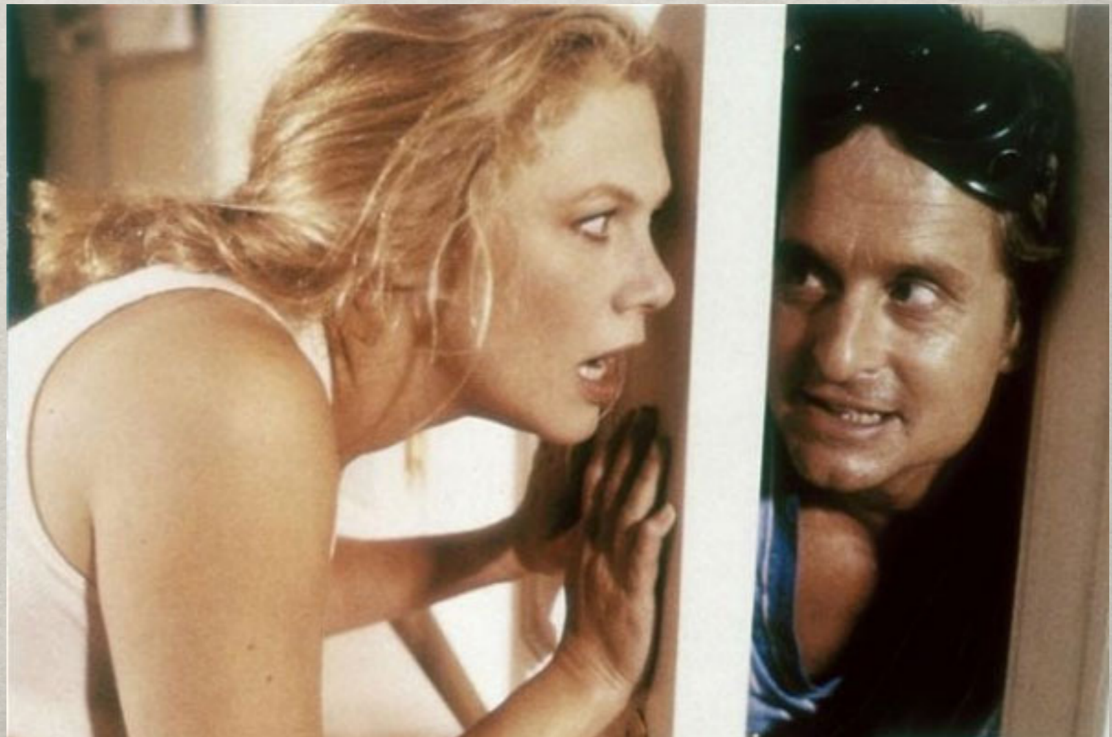
War of the roses, 1989.