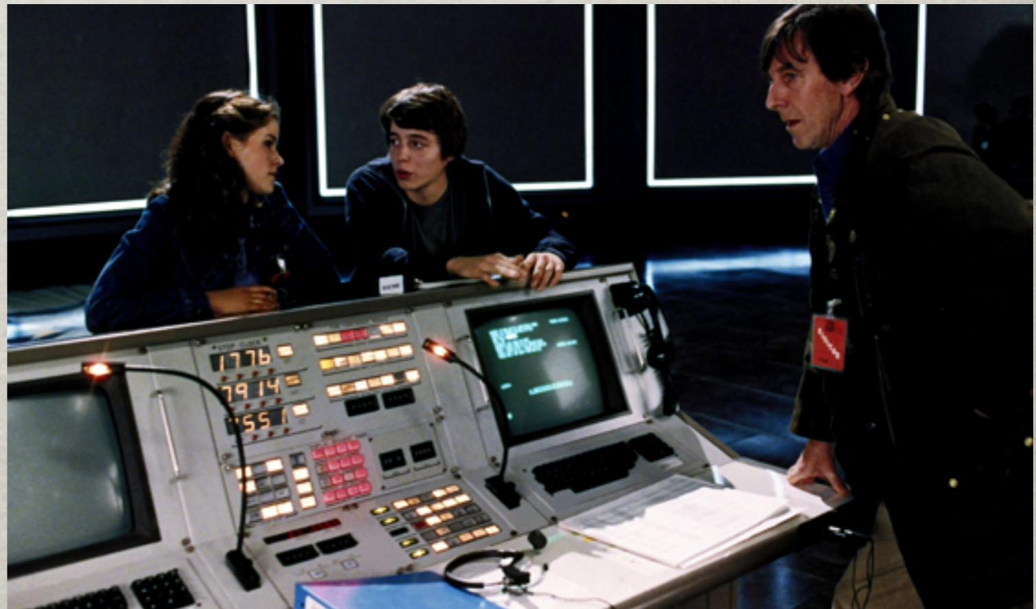
War games, 1983.