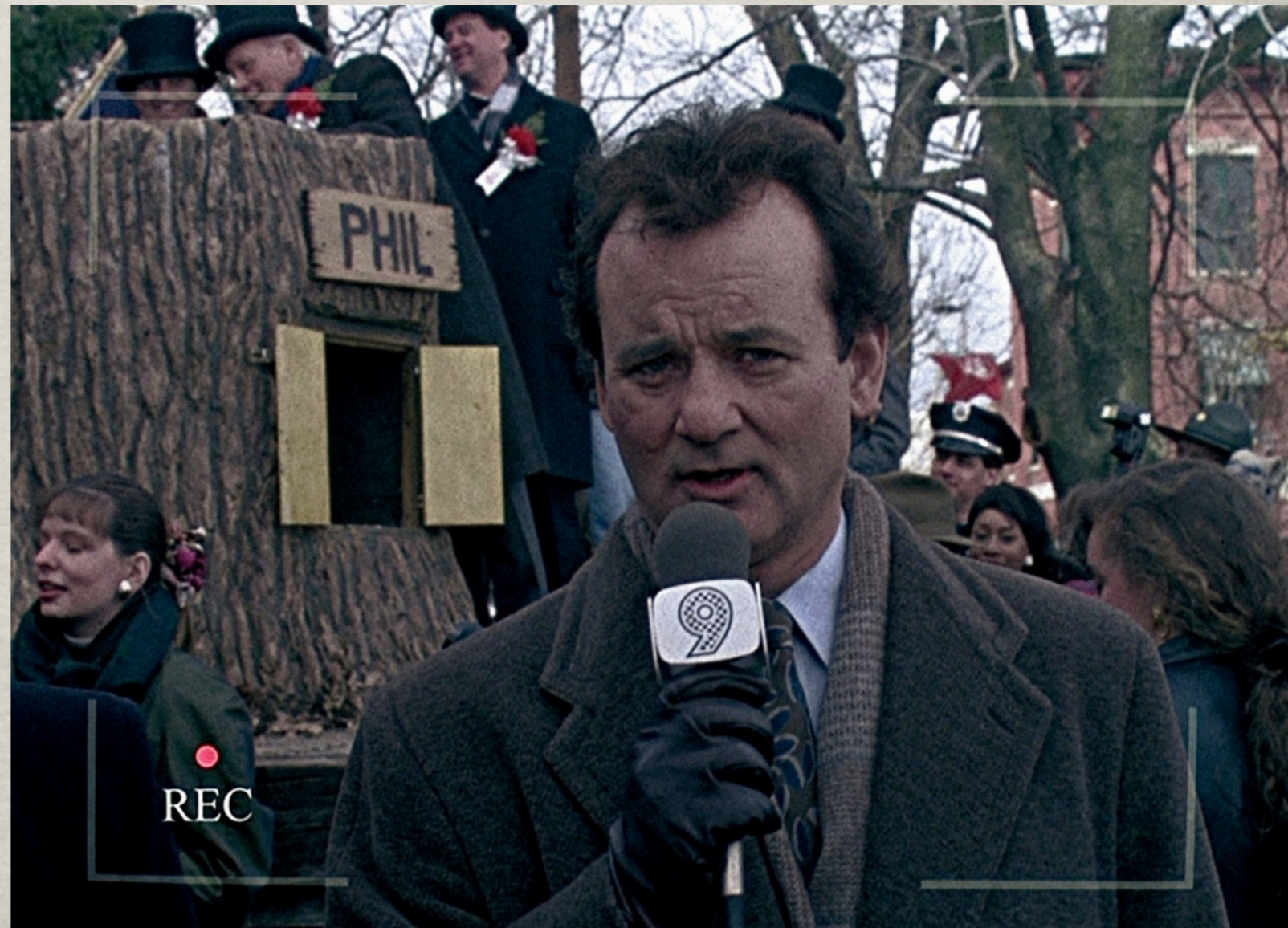
Groundhog day, 1993.